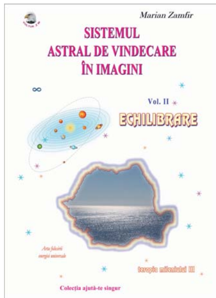
Carte în imagini 400 ron

Practicantul dobandeste arta initierii pentru nivelul II.